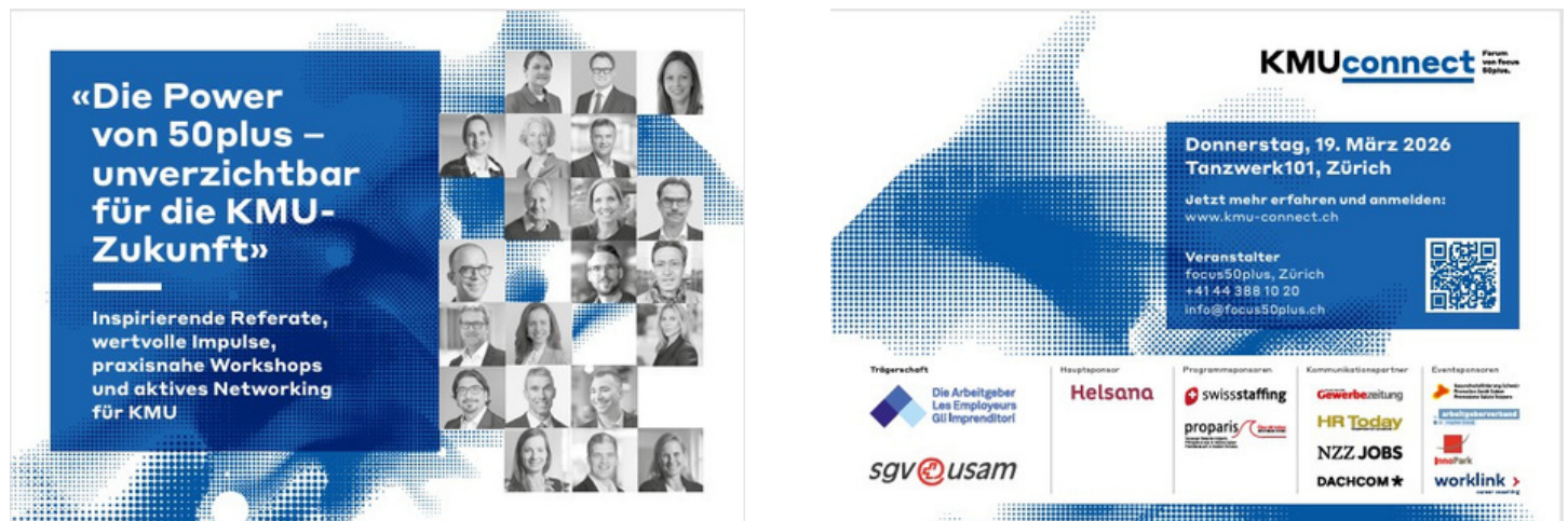
Werbeflyer KMUconnect 2026

Erstmals findet KMUconnect – der Jahresevent von focus50plus – unter dem Motto «Die Power von 50plus – unverzichtbar für die KMU-Zukunft» am 19. März 2026 statt. Da es sich um die erste Grossveranstaltung von focus50plus handelt, nutzten wir das Jahr 2025 für die Vorbereitung. Der als jährlich wiederkehrender Event konzipierte Anlass richtet sich, wie der Name sagt, an kleinere und mittlere Unternehmen, die angesichts des Arbeitskräftemangels unter Druck stehen. Dabei liefert die Keynote Impulse über die Arbeitswelt der Zukunft, das Panel diskutiert spannende Perspektiven mit Vertreterinnen und Vertretern aus Wirtschaft, Wissenschaft und Politik. Das World Café als Kernstück des Events – moderiert von Expertinnen und Experten führender Fachhochschulen und KMU – bietet die Gelegenheit für interaktive Diskussionen mit KMUs.