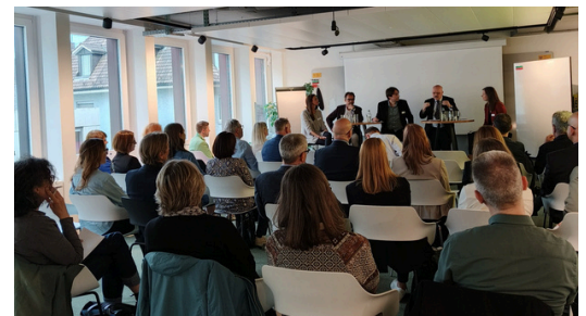
Co-Event HR Today