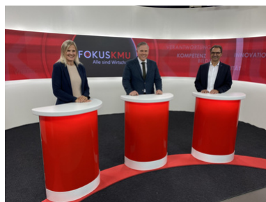
Fokus KMU Talk